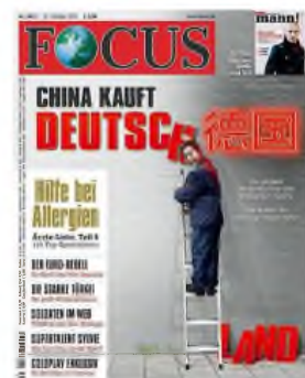
„Kína felvásárolja Németországot”