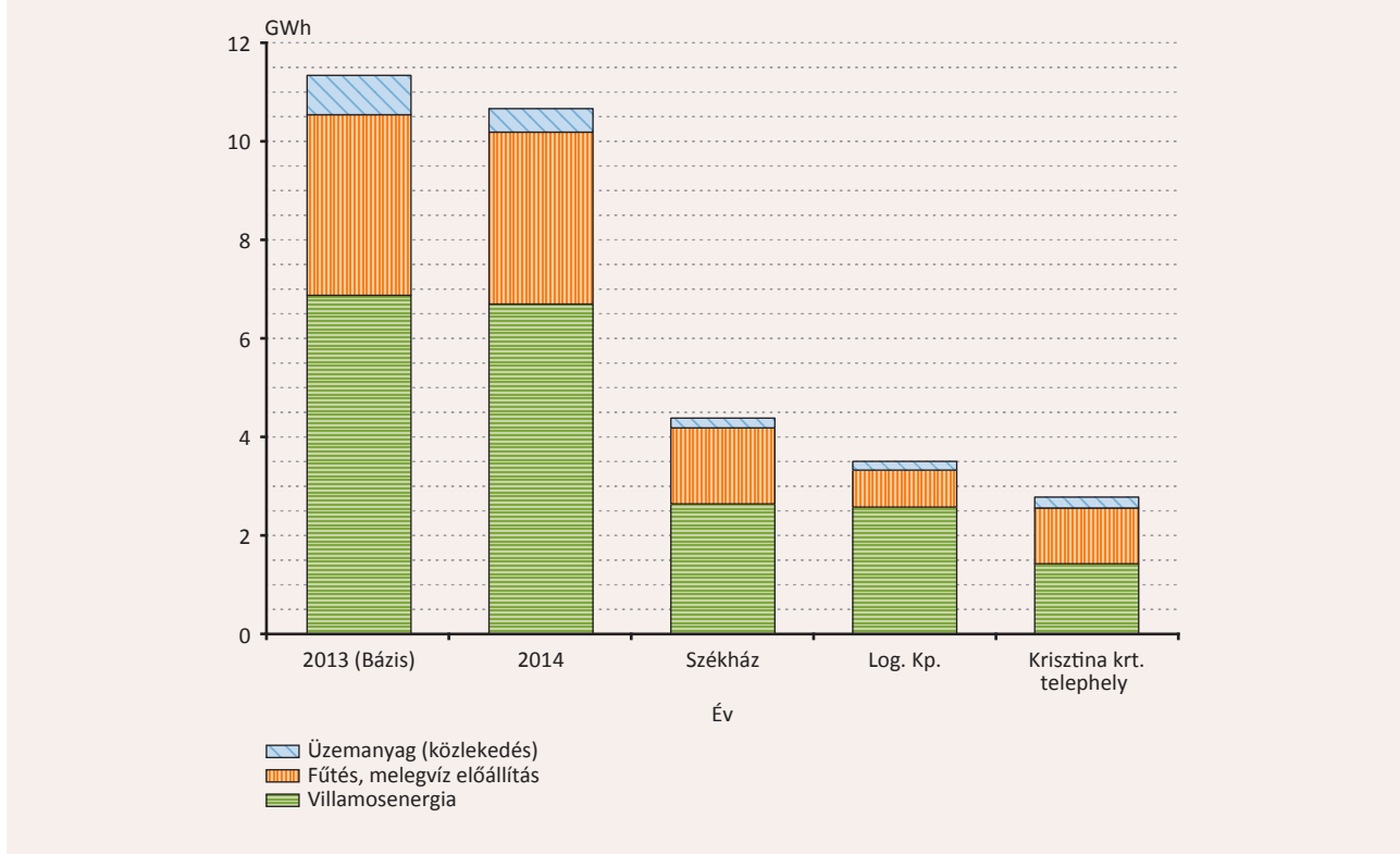
1. ábra Az MNB energiafelhasználásának alakulása

Az energia-hatékonyság növelését komplexen kezeljük és beleértjük a takarékosági, fogyasztás-megtakarítási intézkedéseken túlmenően az energiagazdálkodással kapcsolatos kérdéseket is, mint pl. a lekötött kapacitások folyamatos nyomon követése, lehetőség szerinti csökkentése, amely költségmegtakarítást eredményez. A teljes energiafelhasználásban 2014-ben bekövetkezett csökkenés 45 családi ház éves energiaigényének felel meg.