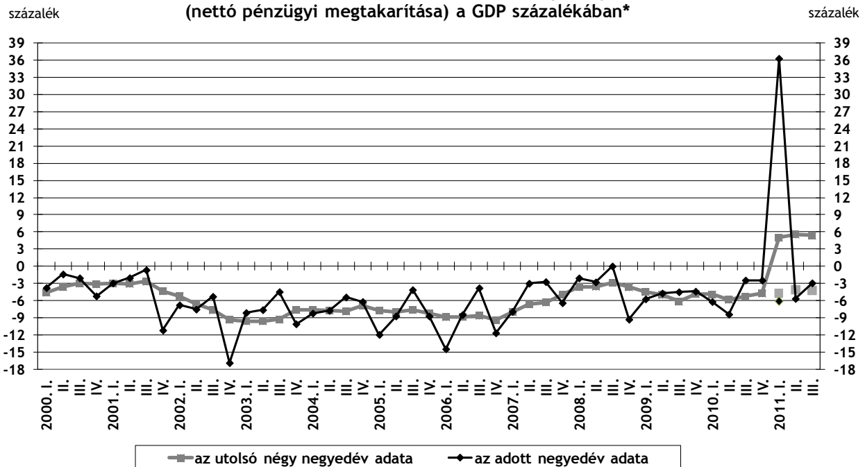
Az államháztartás nettó finanszírozási képessége (nettó pénzügyi megtakarítása) a GDP százalékában*

*2011 harmadik negyedévére vonatkozó adathoz az MNB a saját GDP-bebecslését használta.