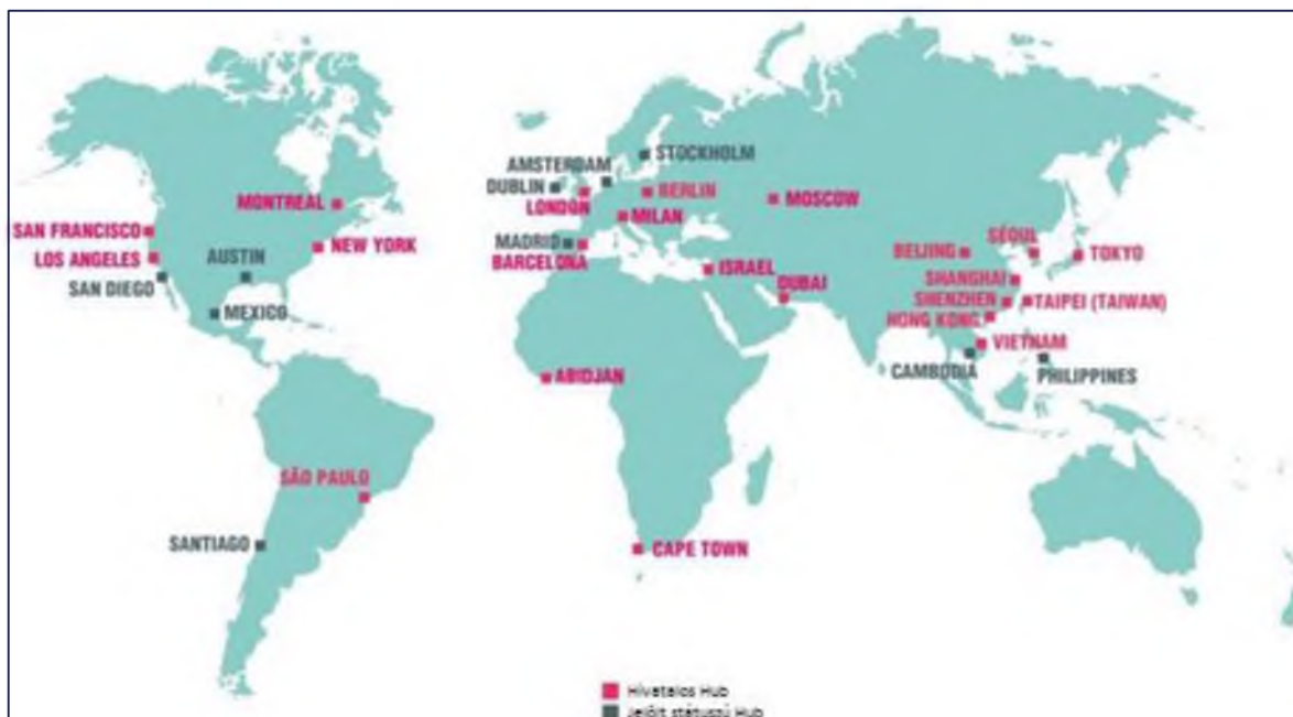
2. ábra Nemzetközi French Tech hálózat