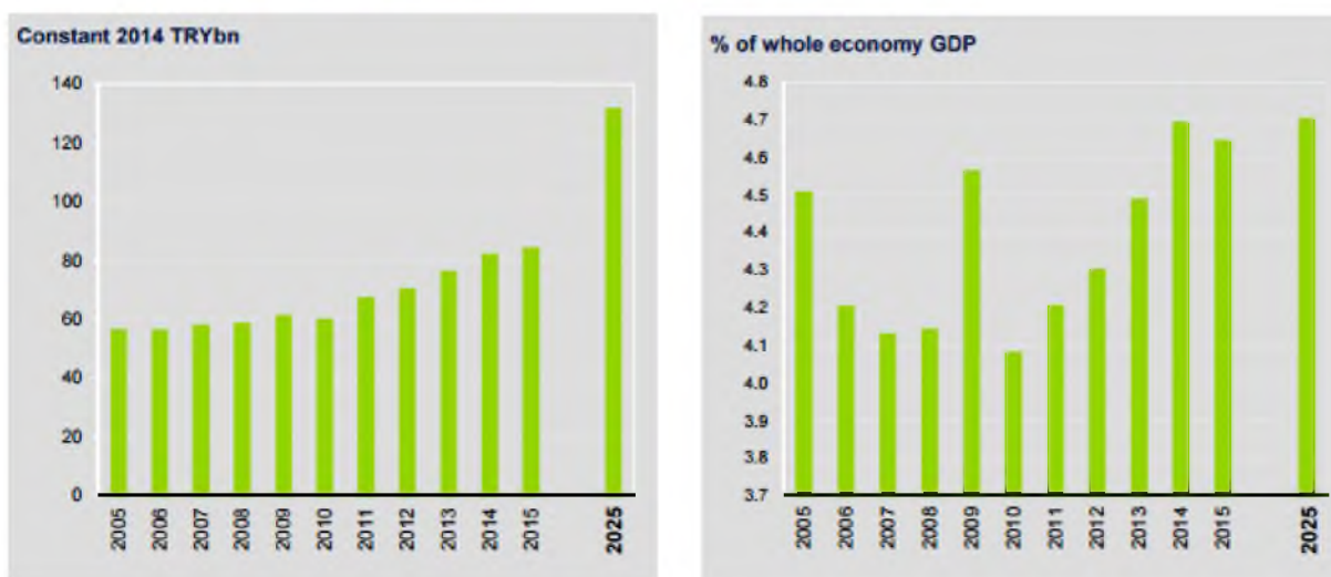
3. ábra - Az utazás és a turizmus direkt hatása a török GDP-re