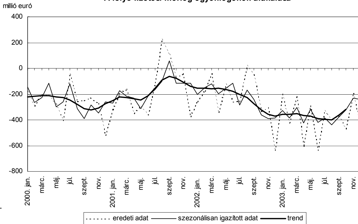
A folyó fizetési mérleg egyenlegének alakulása

2003. decemberben 437 millió euró hiánnyal zárt a folyó fizetési mérleg. Figyelembe véve a 2003. január-november időszakra 2004. február 10-én közzétett vámstatisztikai korrekciókat tartalmazó legfrissebb - nem végleges - adatokat, az éves folyó fizetési mérleg hiány 4,2 milliárd euró körül alakult. A jelenleg publikált 2003. január-novemberi havi fizetési mérleg adatok még nem tartalmazzák az ezen időszakra vonatkozó korrigált vámstatisztikai számokat 1 , így a havi adatok alapján számítható éves egyenleg -4584 millió euró. A szezonális adatok számításánál azonban már figyelembe vettük ezeket a korrekciókat. Az alábbiakban bemutatott szezonálisan kiigazított adatok alapján az év második felében csökkent a folyó fizetési mérleg hiány. Ennek alakulásában elsősorban az áruforgalom egyenlegének javulása játszott szerepet. A jövedelmek és a viszonzatlan átutalások egyenlege kiegyensúlyozott képet mutatott az év folyamán. 2003-ban a folyó fizetési mérleg hiány közel 10 százalékát finanszírozta nem adóssággeneráló forrás, így az év folyamán a nemzetgazdaság külfölddel szembeni nettó adóssága nőtt.