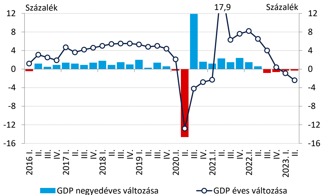
1. ábra: A hazai GDP alakulása éves és negyedéves összevetésben

Megjegyzés: A negyedéves változás szezonálisan és naptárhatással igazított adatok alapján.