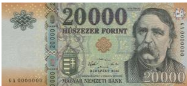
Az új 20 ezer forintos bankjegy