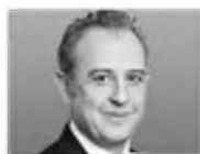
Arturo Sarukhan Mexico