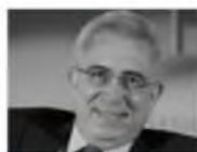
Ernesto Zedillo Mexico