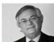
Moisés Naím Venezuela