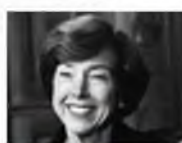
Carla A. Hills United States