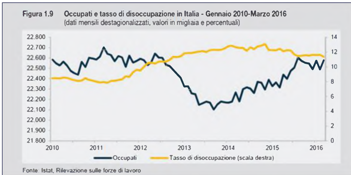
3. ábra Az olasz foglalkoztatottság (sötétkék) és a munkanélküliség (sárga) alakulása 2010 januárjától 2016 márciusáig

A munkanélküliség 2016-ban tovább csökkent, májusban már csak 11,5%-os volt, 36 június hónapban viszont minimálisan újra emelkedett és 11,6%-ot regisztráltak. A munkanélküliek száma idén júniusban 27 000 fővel (0,9%-kal) nőtt, ez 0,1%-kal magasabb, mint a májusi adat. 37