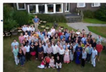
La summer school all'Institute for Social Banking